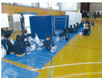
施設管理班：避難会場設置