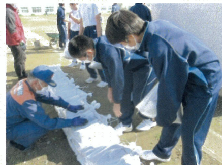
施設管理班：土のう設置作業②