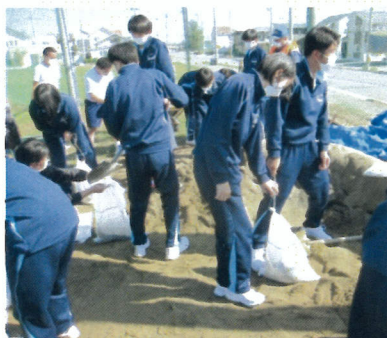
施設管理班：土のう設置作業①