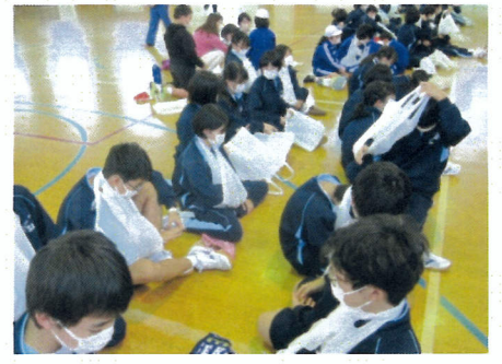
身近なものでの応急手当