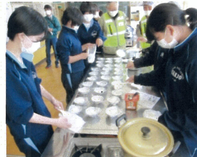
食料物資班：炊き出し作業