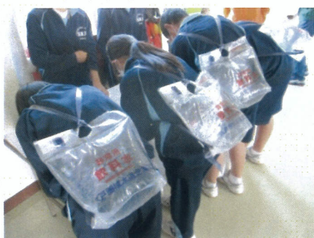
避難者管理班：避難者受付